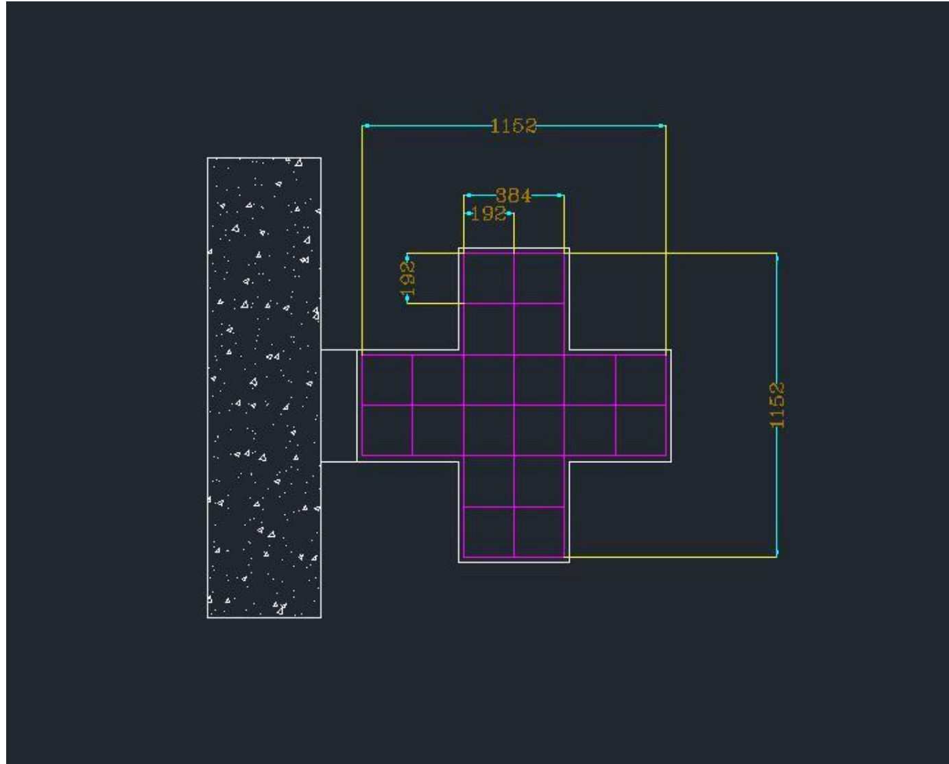
Misure moduli – croci RGB a LED